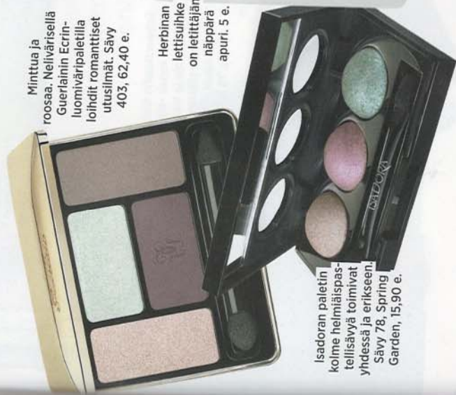
Minttua ja roosaa. Neliivarisellä Guerlainin Ecrin-luomiväripaletilla loihdit romanttiset utusilmät. Sävy 403. 62,40 e.

Letitä hiukset otsalle tai tavoitele tuulen tuivertamaa tyylä. Utuisen pastellinen silmämeikki tekee lookista söpön romanttisen.