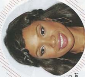
Ihastuttava Jennifer Hudson letitti vain etuhiukset ja levitti luomilleen helmiäistä roosaa.