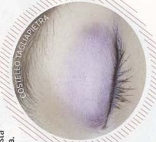
POSTELLO TAGI LAPIETRA