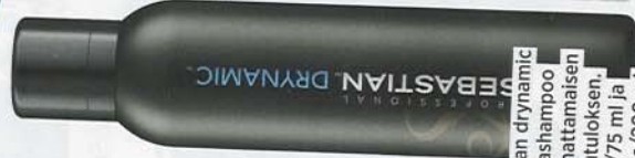
Sebastian drynamic LETTITYS- ja kuivashampoo antaa mattamaisen lopputuloksen. 15 e/75 ml ja 29,90 e/200 ml.