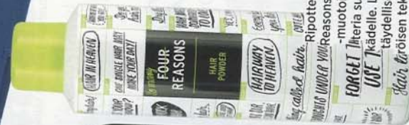
Ripottele Four Reasons Duster-muotoilupuurotta suoraan kädelle. Letti saa täydellisen pöröisen tekstuurin. 11,50 e/250 ml.