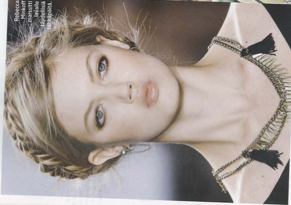
Rebecca Minkoff marssitti lavalle täydellisiä tähtiköpäitä.