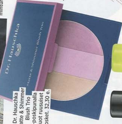
Dr. Hauschka Matte & Shimmer Blush Trio -poskipunalla luot ruusuiset posket. 32,30 e.

Badgley Mischkan näytöksen sumusilmät loihdittiin mintunvihreällä.